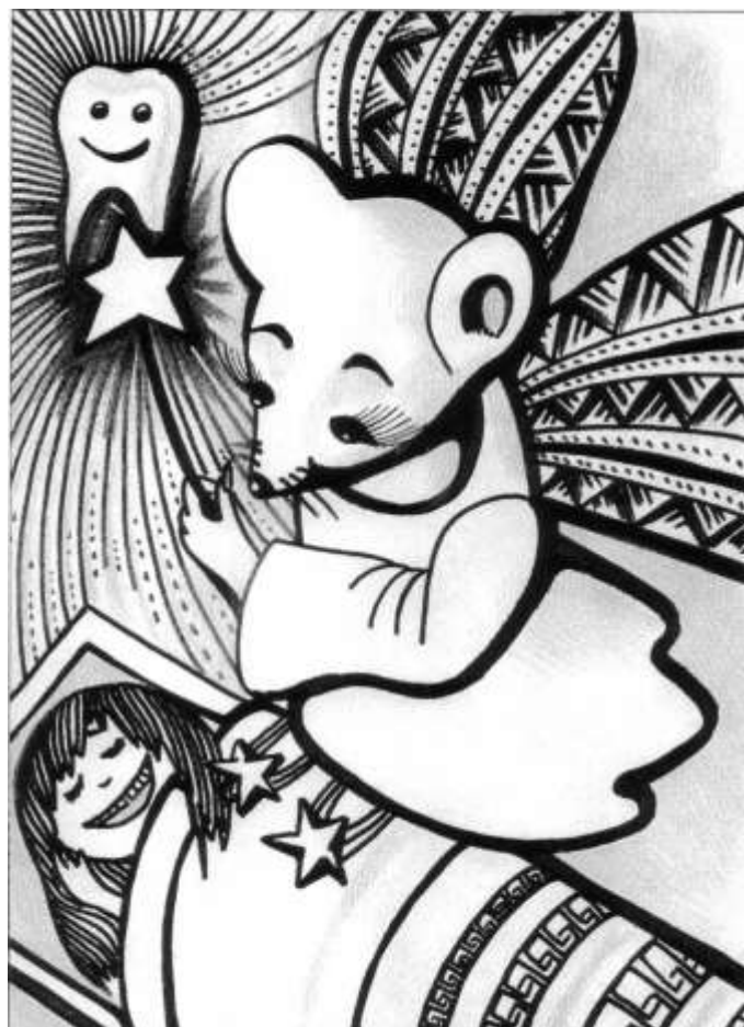
Paula Sekača, 10. klase, Pāvilostas vidusskola. Zīmējums ievietots 2008. gada Liepājas rajona Izglītības pārvaldes veidotajā kalendārā.