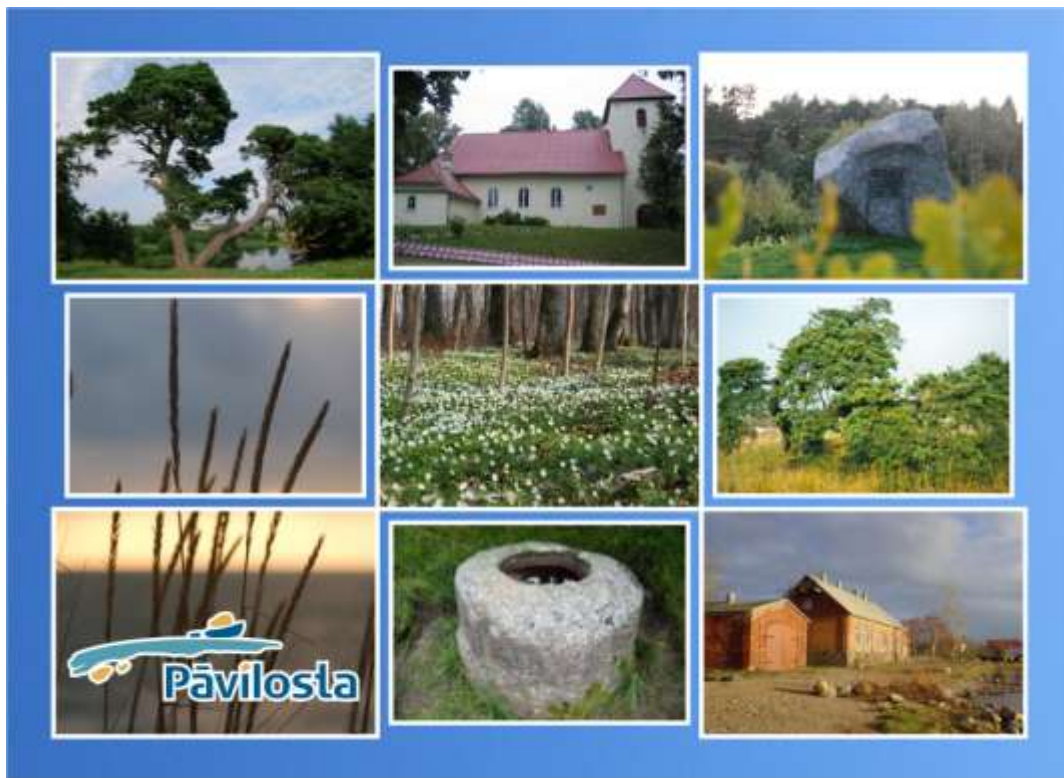
Viena jaunajām skatu kartītēm.

Gatavojoties jaunajai tūrisma sezonai, Pāvilostas tūrisma informācijas centrs sadarbībā ar Sakas novada domi, Pāvilostas novadpētniecības muzeju un Liepājas reģiona tūrisma informācijas biroju ir pabeidzis darbu pie jaunu - kopā četru - Pāvilostas skatu kartīšu maketu izgatavošanas, kas ir jau nodoti tipogrāfijā.