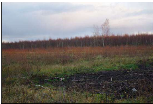
Zemes vienība ar kadastra apzīmējumu 6496 008 0110