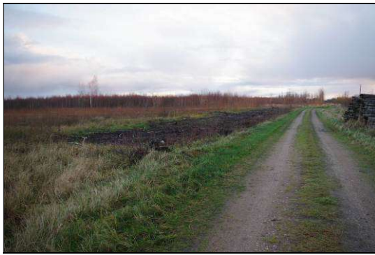
Zemes vienība ar kadastra apzīmējumu 6496 008 0110