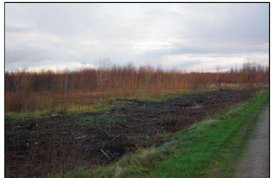
Zemes vienība ar kadastra apzīmējumu 6496 008 0110