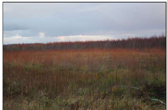
Zemes vienība ar kadastra apzīmējumu 6496 008 0110