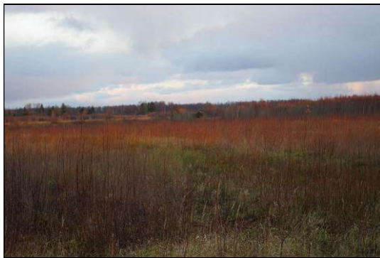
Zemes vienība ar kadastra apzīmējumu 6496 008 0110