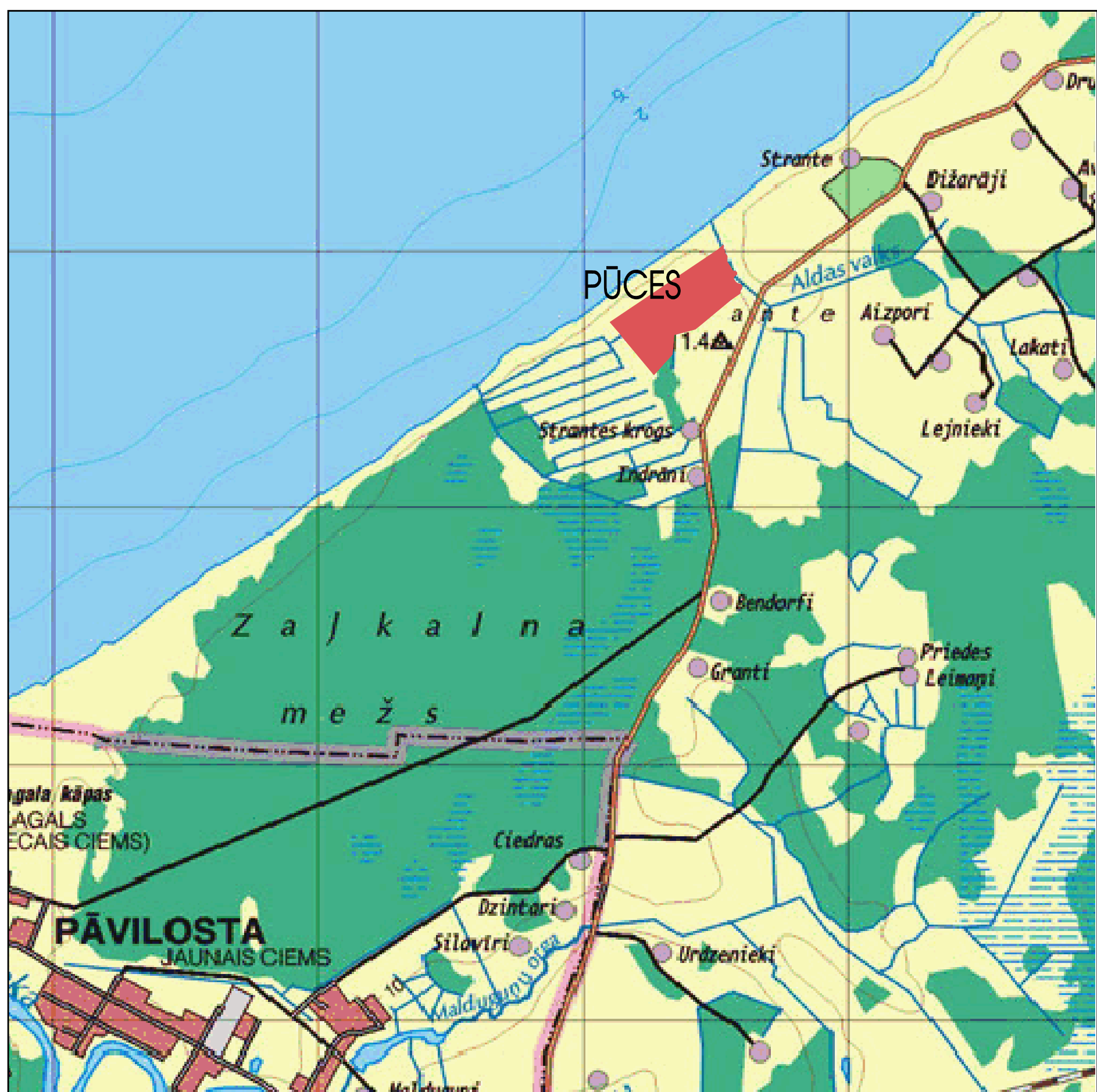
ZEMESGABALA NOVĪETOJUMS KVARTĀLĀ