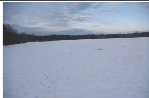
Zemes vienība ar kadastra apzīmējumu 6486 006 0030