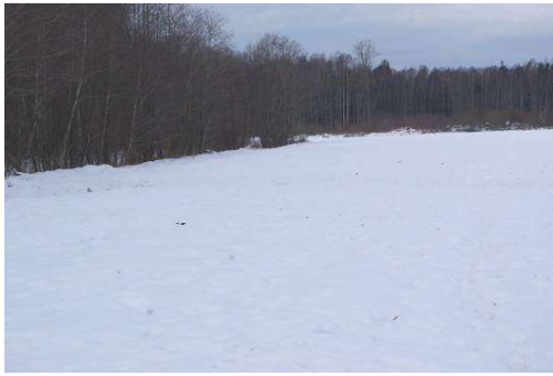
Zemes vienība ar kadastra apzīmējumu 6486 006 0030