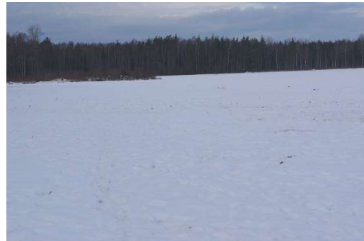
Zemes vienība ar kadastra apzīmējumu 6486 006 0030