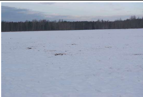
Zemes vienība ar kadastra apzīmējumu 6486 006 0030