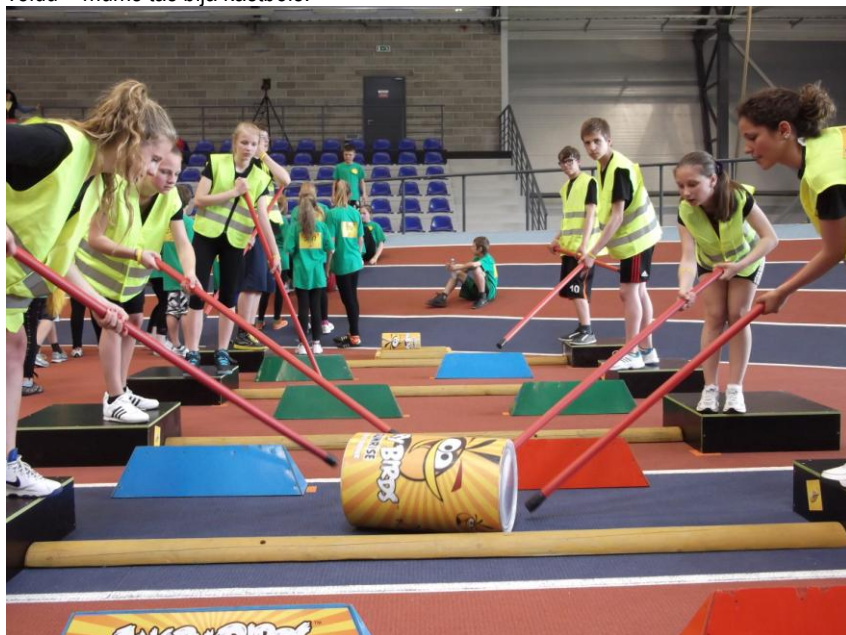
ZZ čempionāts Kuldīgā.

Savukārt 18. un 19.maijā Vērgales pamatskolas folkloras kopa piedalījās Latvijas bērnu folkloras sarīkojumā „PULKĀ EIMU, PULKĀ TEKU” Kuldīgā un Alsungā. Viens no spilgtākajiem gada notikumiem ir 8. klases skolēnu piedalīšanās ZZ čempionātā. Lai tiktu uz pusfinālu, klasei vajadzēja izdomāt un nofilmēt jaunu sporta veidu – mums tas bija kastbols.