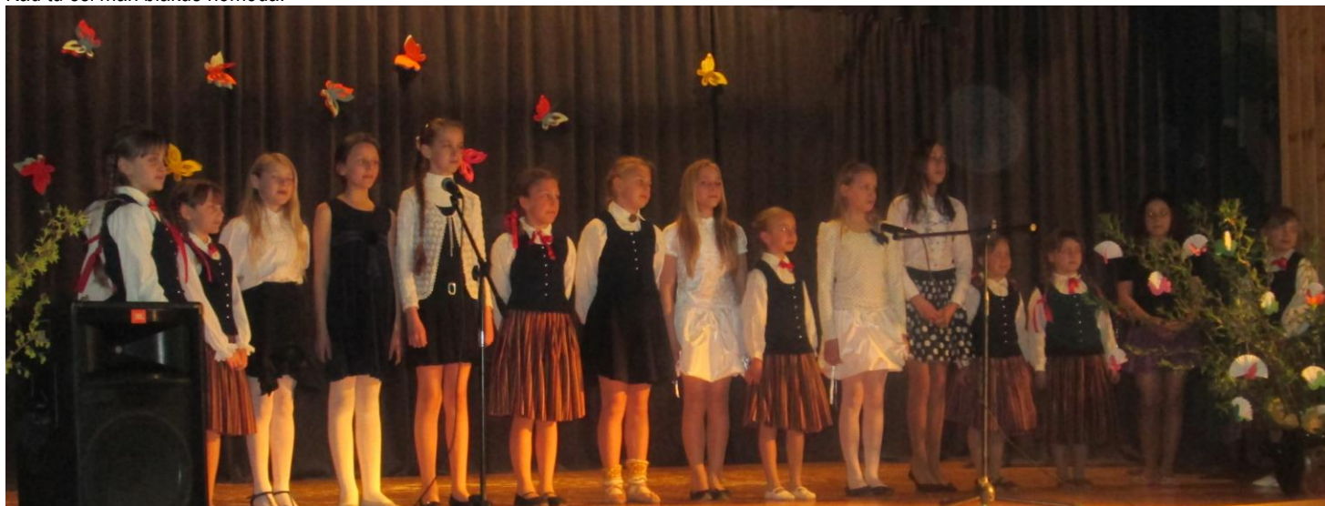
Folkloras kopa un meiteņu ansamblis.

Ar sagatavoto programmu folkloras pasākumam Alsungā „Tēvu tēvi laipas meta, bērnu bērni laipotāji” uzstājās Vērgales pamatskolas folkloras kopa un meiteņu ansamblis. Savukārt dejot prasmi vecākiem rādīja 1. – 3.klašu un 4. – 6.klašu deju kolektīvi. Dziesmu un deju starplaikos tika runāti dzejoļi un tautas dziesmas par bērniem un māmiņām.